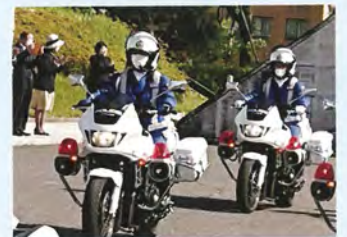
▲交通安全運動の出発式