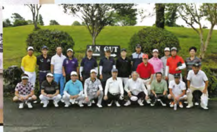
▲チャリティーゴルフコンペ