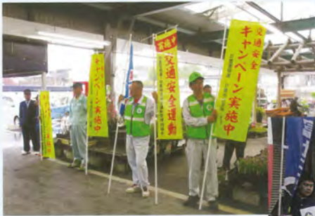
▲キャンペーンの様子