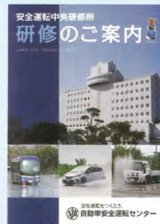
▲研修案内パンフレット