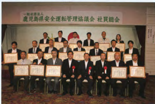
▲受賞の様子 (前列中央は本部長・会長・交通部長)

更に、長年、功労のあった方は、経験年数や表彰歴に応じて、九州管区や全国の表彰も受賞できます。